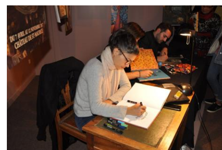
Séance dédicaces par les 3 artistes