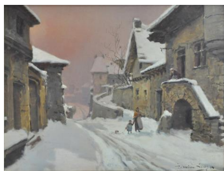
Théodore Lévigne, « Paysage sous la neige » Collection particulière

Le musée a proposé deux visites en LSF l'année dernière. Cette initiative sera renouvelée en 2018. Deux visites auront donc lieu : l'une en février, l'autre en juin.