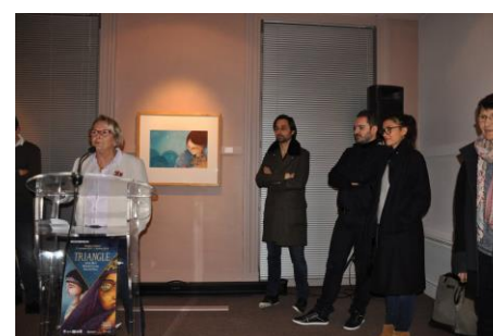
Vernissage de l'exposition « Triangle »