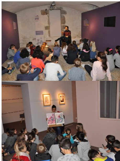
Plusieurs classes de primaire ont rencontré les 3 artistes