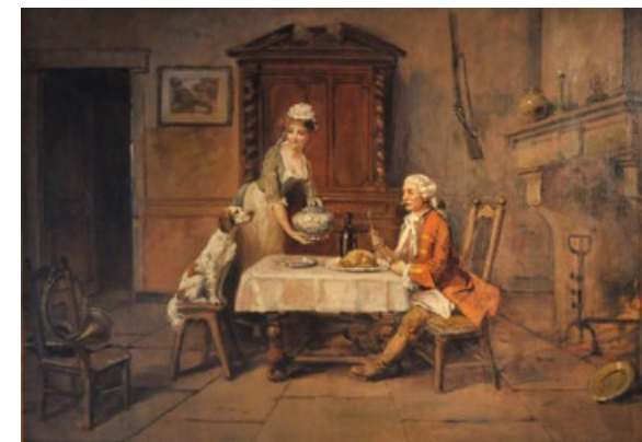
Repas de chasseur – Théodore Lévigne Collection particulière

Mercredi 14 Exposition temporaire Fête du Livre 2018 : Voyages (p.5)