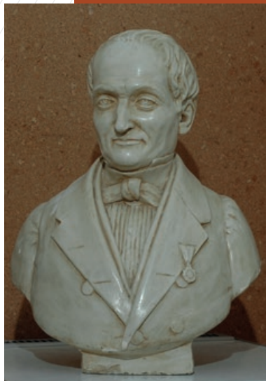
Buste de Jean-Baptiste d'Allard