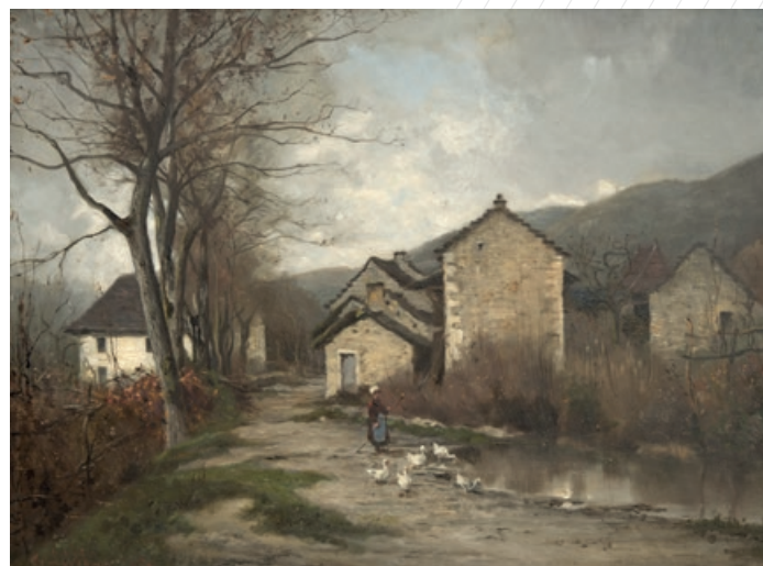
Théodore Lévigne - La gardeuse d'oies - Musées départementaux de l'Ain