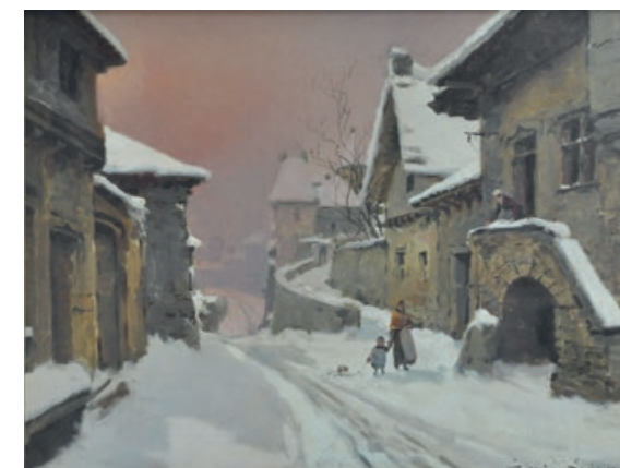
Théodore Lévigne - Paysage sous la neige - Collection particulière