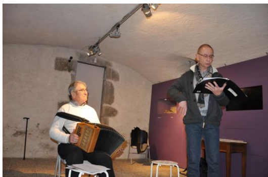
Le printemps des poètes pour la première fois au musée